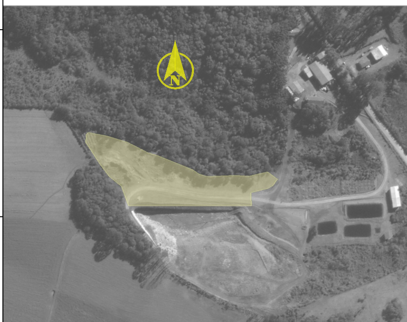
Localização Escala 1:5000